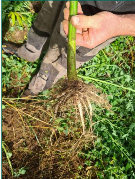
Un bon système racinaire