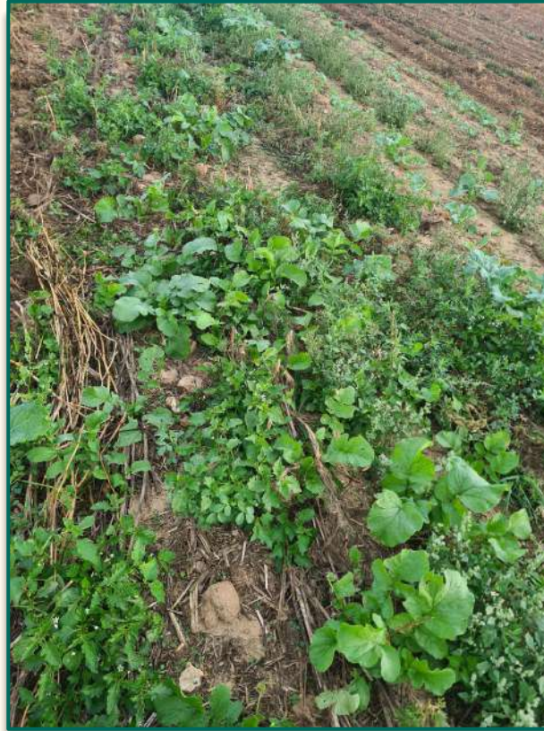
A la volée