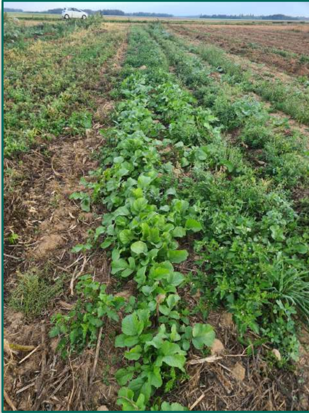
Avec le semoir de précision.