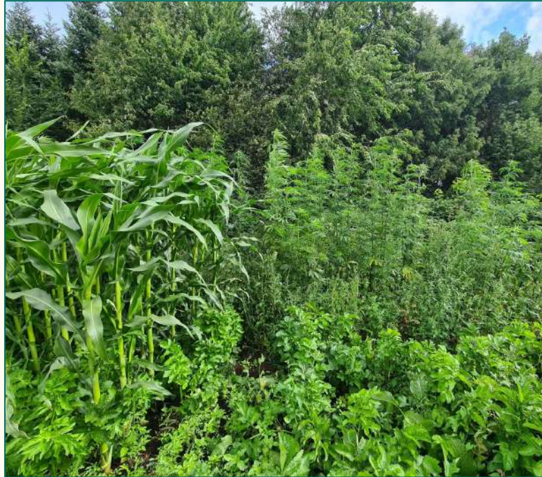
Une bonne canopée, or, la densité n'est pas aussi élevée que le maïs !